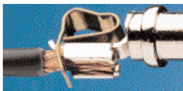
стопроцентный контакт: с многожильным проводом