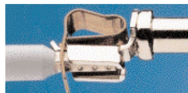
многожильный провод (опрессованный наконечником)